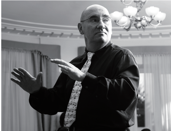
지휘자 이고르 튜바예프