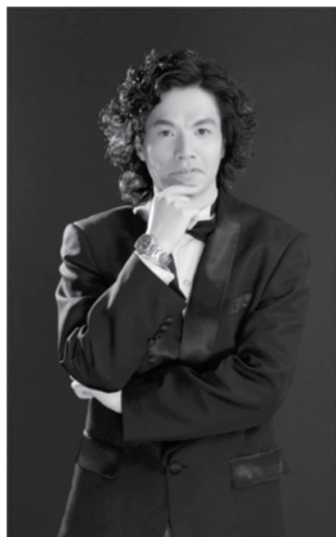
지휘자 조우 웨이핑 Zhou Weiping, Conductor

지휘자 조우 웨이핑(Zhou Weiping)은 제지앙 박물관의 사회 문화 훈련센터 감독, 연구사서, 중국 음악협회 정회원, 제지앙 합창협회 사무총장, 항저우 필하모닉 앤젤 코러스와 항저우 필하모닉 챔버코러스 음악감독이다. 그는 항저우 필하모닉 합창단 창단자로서 국내외 합창대회에서 많은 수상을 했고, 그의 섬세하고 정확하고 표현적인 음악으로 영향력 있는 젊은 지휘자로 인정받고 있다.